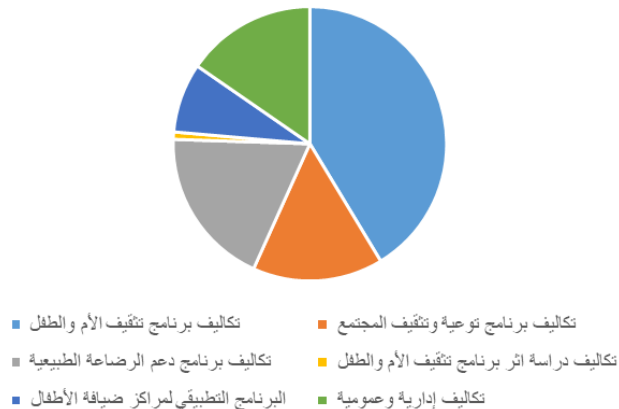
التكاليف حتى نهاية الربع الرابع لعام ٢٠٢١م

إجمالي التكاليف حتى نهاية الربع الرابع من عام ٢٠٢١م = ٥,١٨٢,٦٧٦ ريال